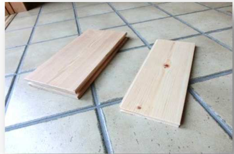
杉 150×30 桧 110×15