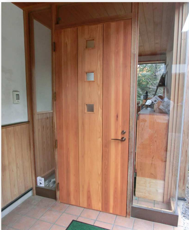
杉板目巾ハギ材/自然オイル塗装 仕様