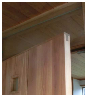
スッキリとしたデザインを可能としたT框